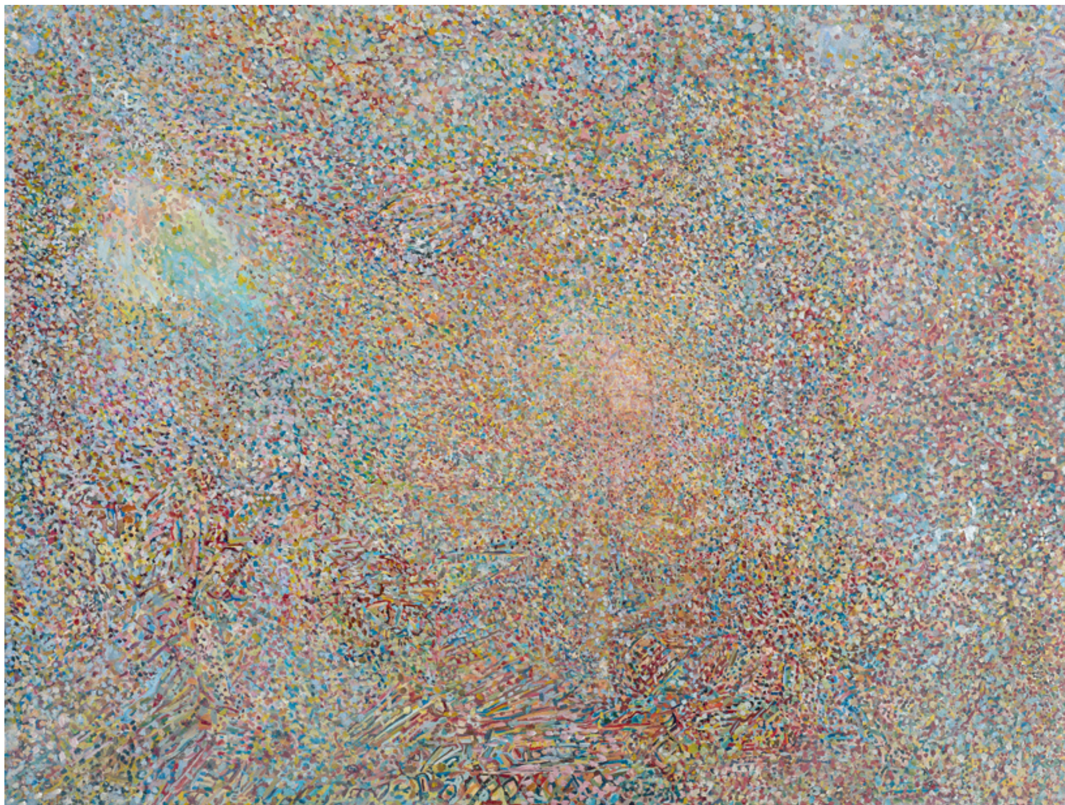
י'ראש', שחון על בד 'Head', Oil on Canvas