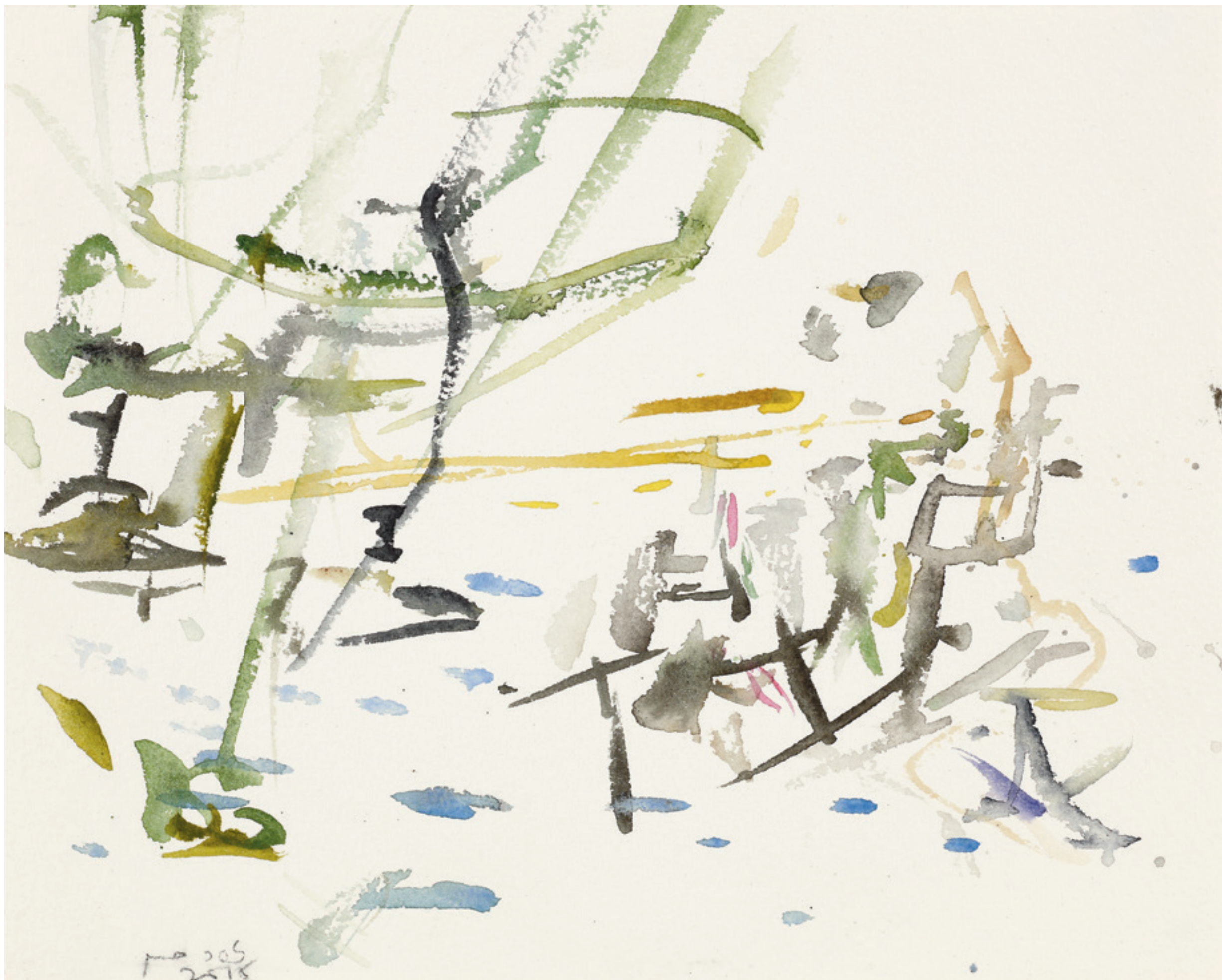
יער אודם, צבעי מים על נייר 'Odem Forest', Watercolor on paper