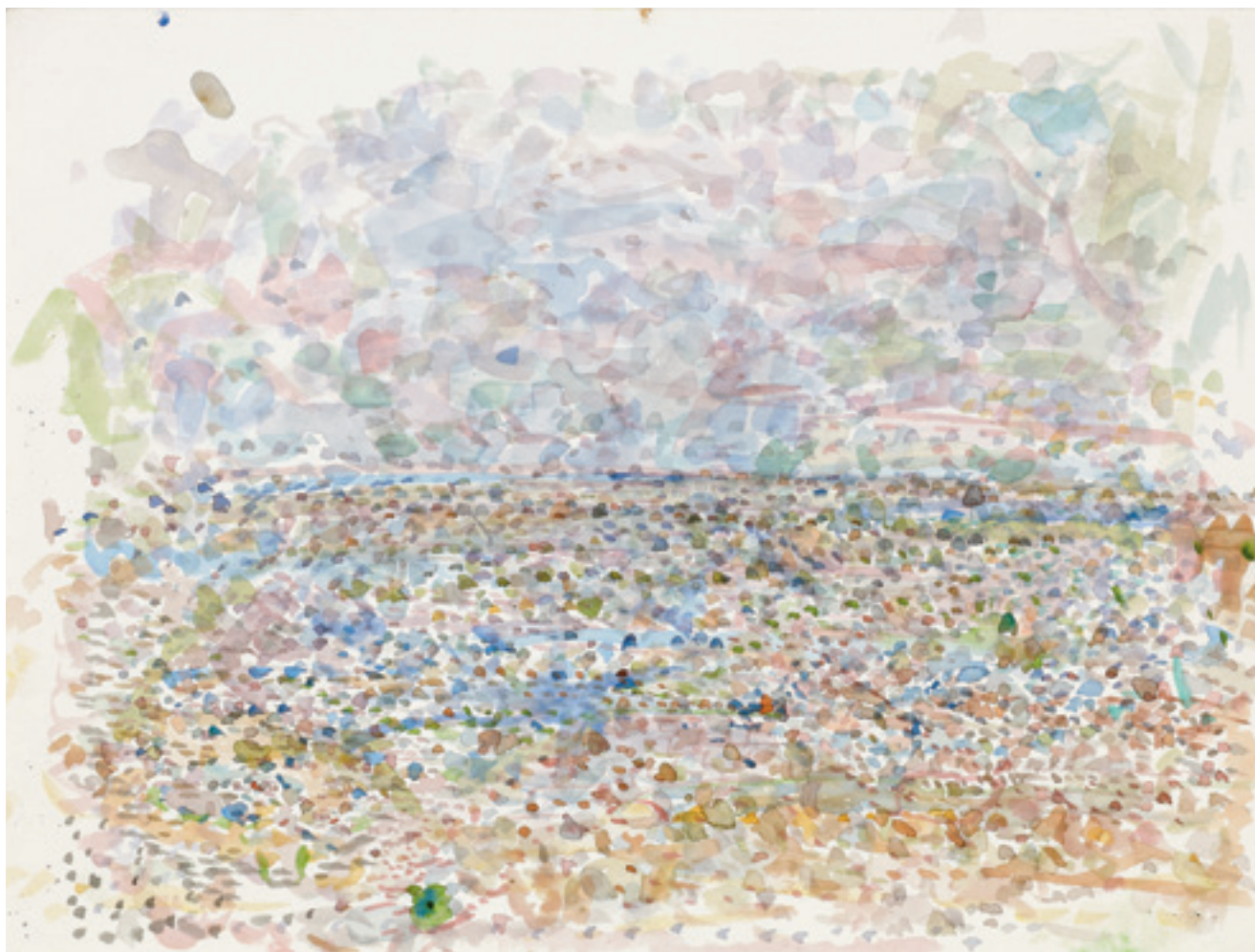
‘אכזיב’, צבעי מים על נייר Akhziv', Watercolor on paper