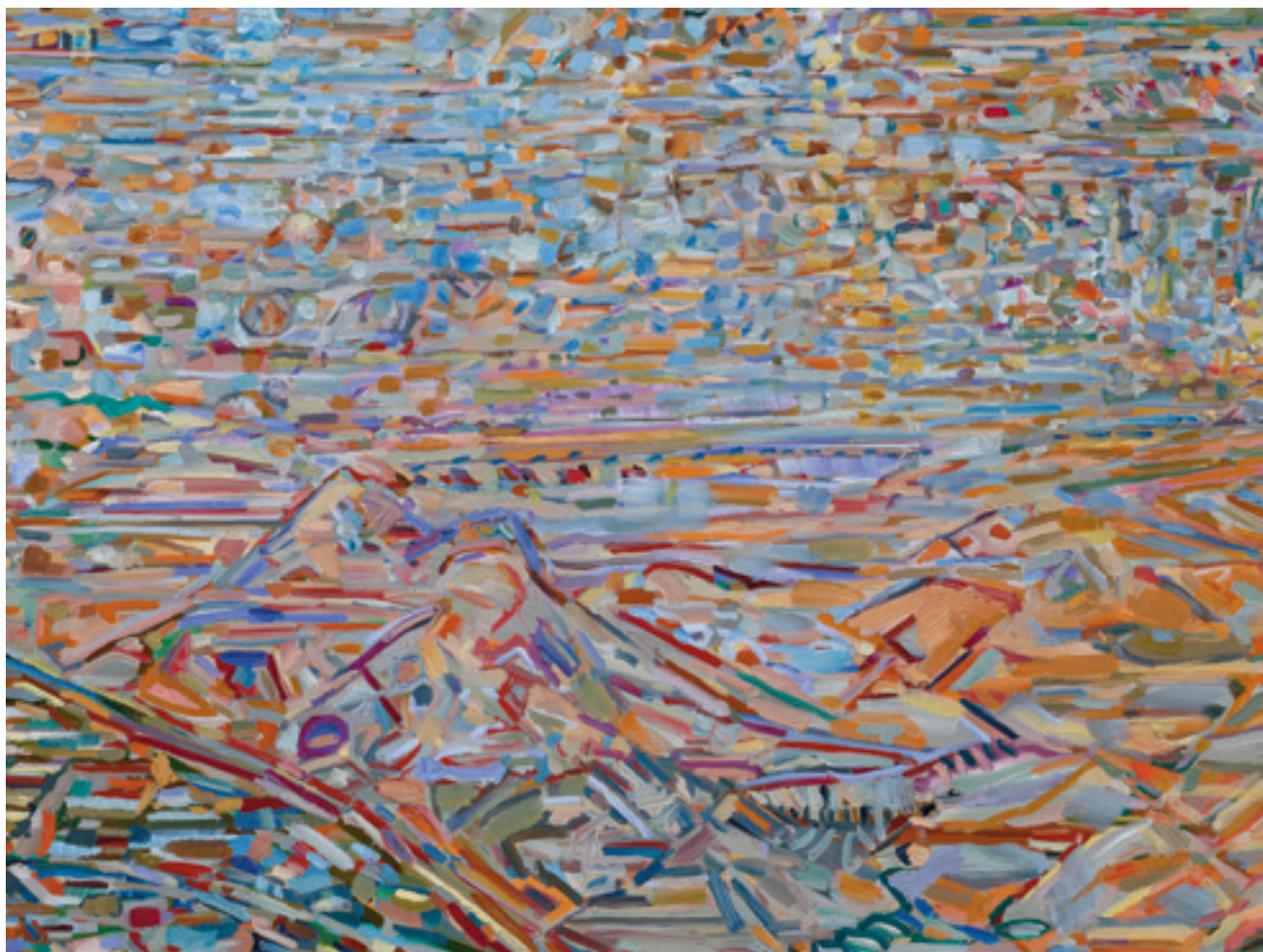
פרט מתוך 'נחל רחף' Detail from 'Nahal Rahaf'