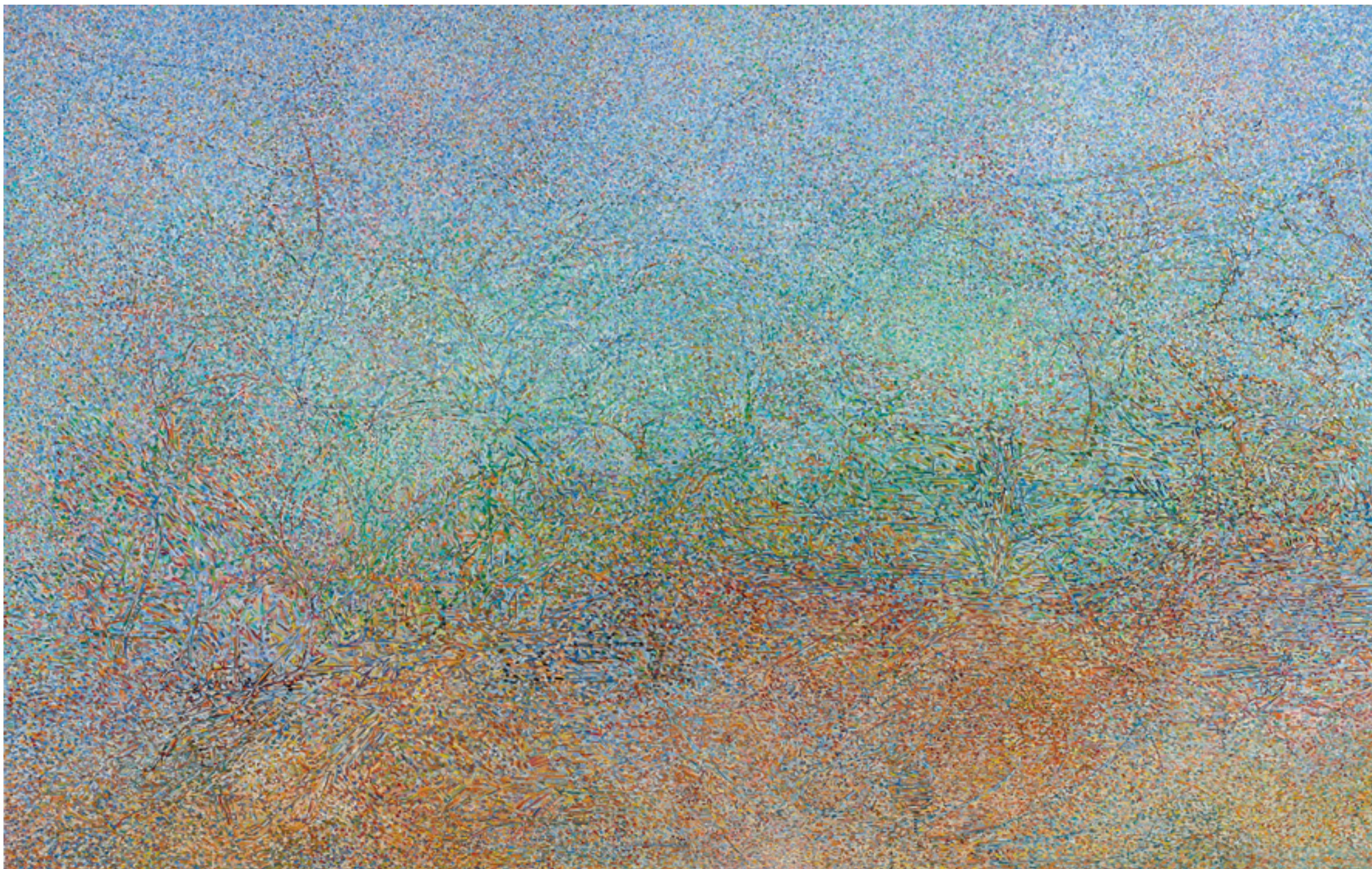
יער אודם, שמן על בד 'Odem Forest', Oil on Canvas