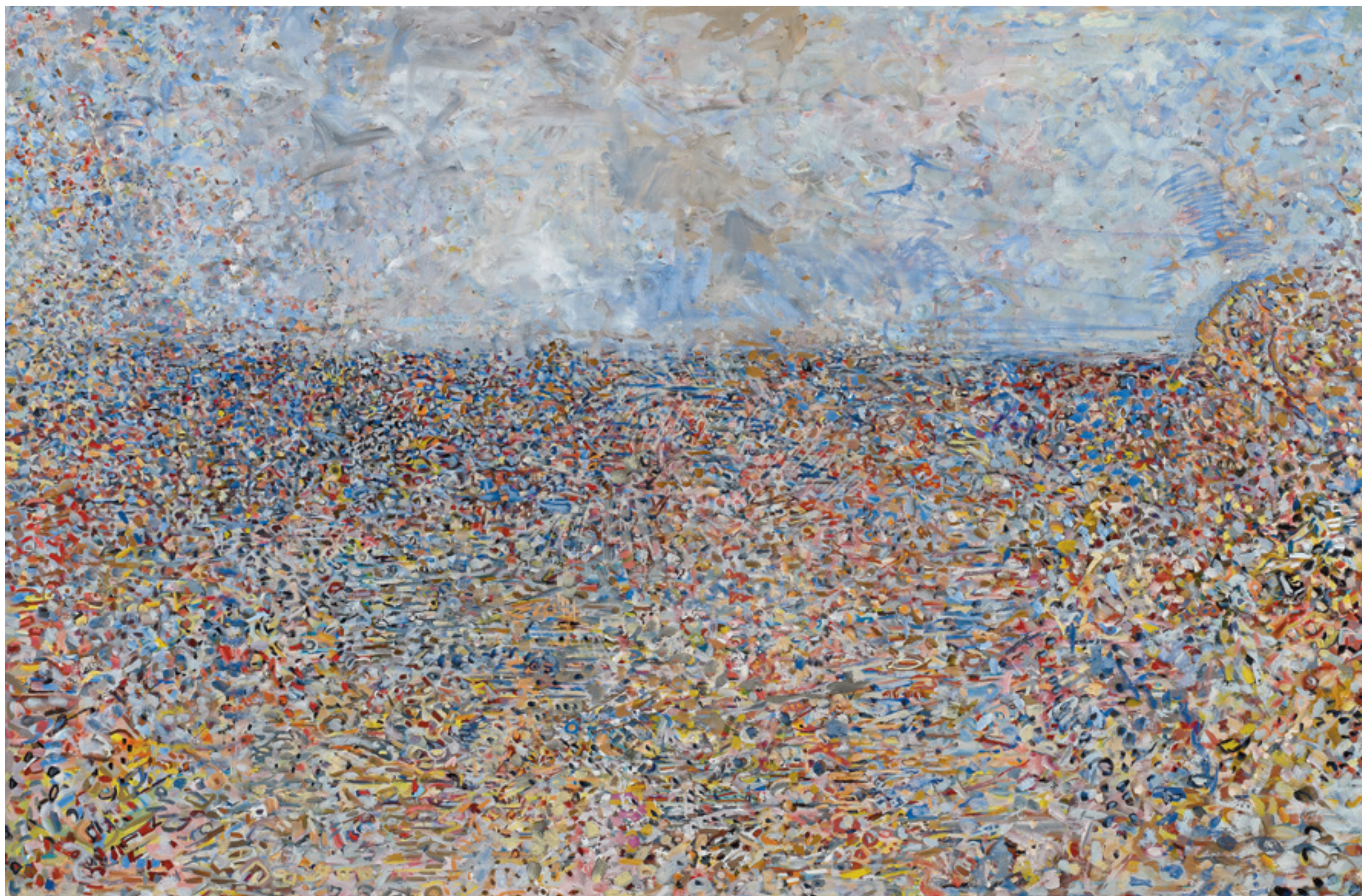
'אכזיב', שמן על בד 'Akhziv', Oil on canvas